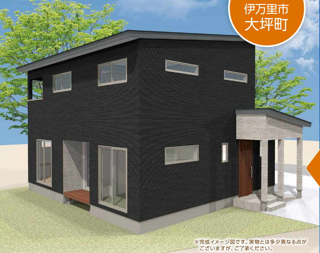
※完成イメージ図です。実物とは多少異なる点が ございますが、ご了承ください。