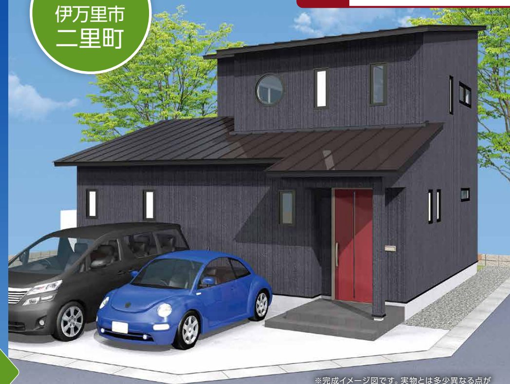
※完成イメージ図です。実物とは多少異なる点が ございますが、ご了承ください。