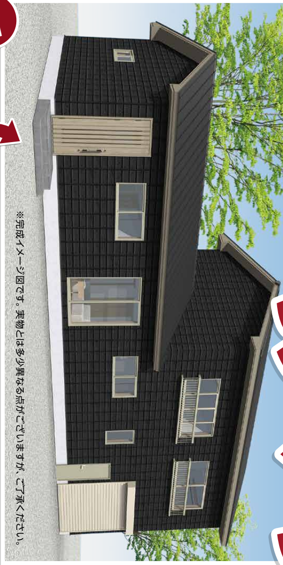
※完成イメージ図です。実物とは多少異なる点がございますが、ご了承ください。