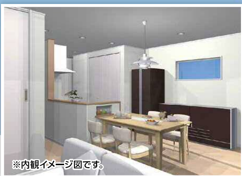
※内観イメージ図です。