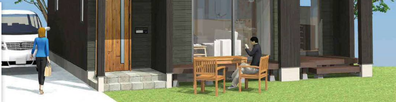
※完成イメージ図です。実物とは多少異なる点がござりますが、ご了承ください。