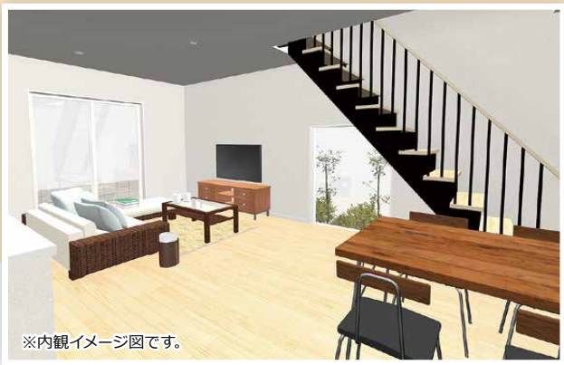
※内観イメージ図です。