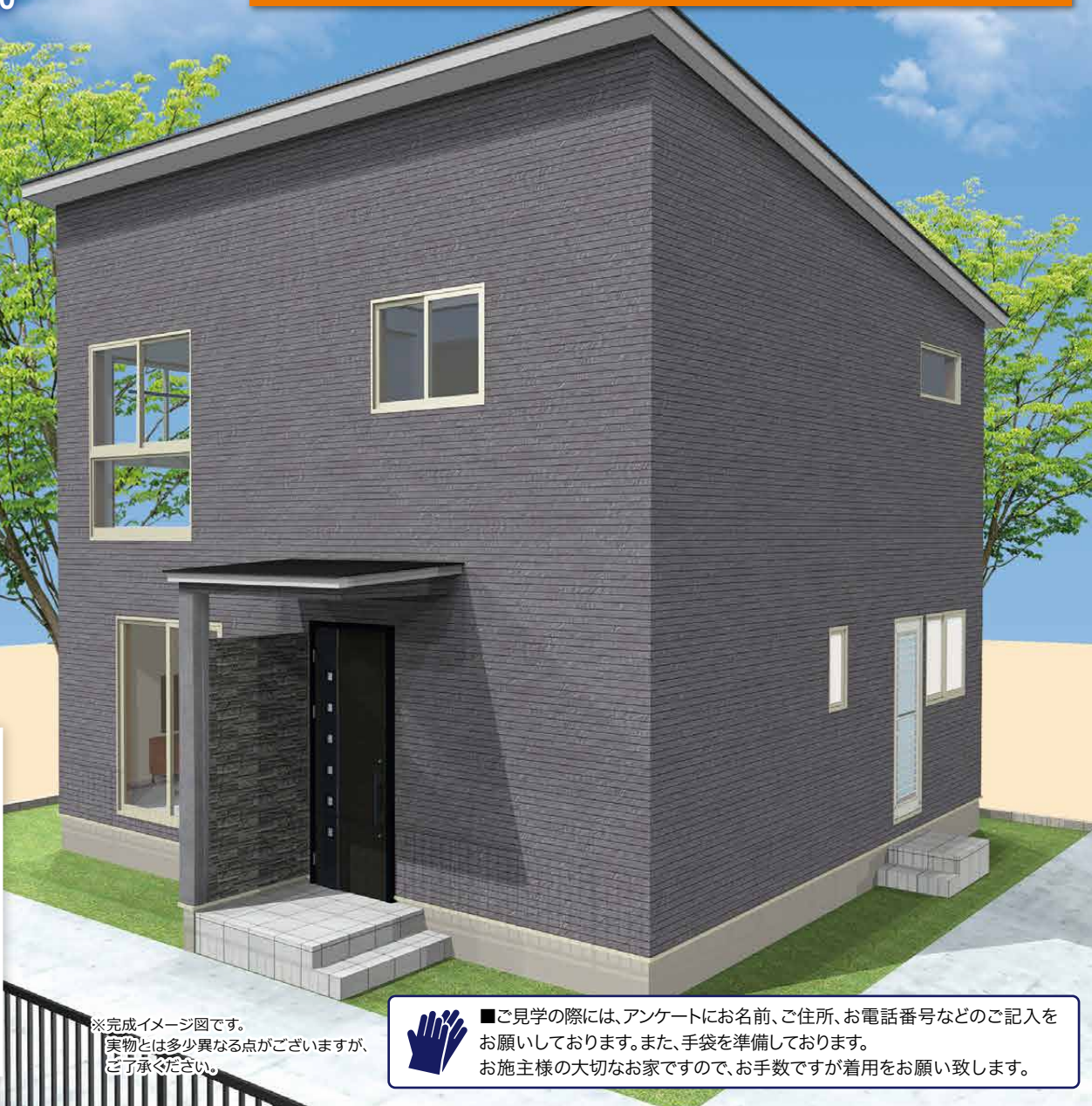
※完成イメージ図です。実物とは多少異なる点がござりますが、ご了承ください。